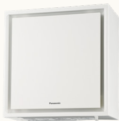
第1種熱交換換気システム